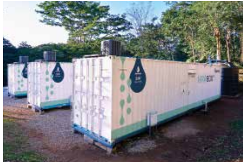
Planta de desalinización paquetizada inteligente NIROBOX™