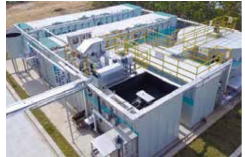
Aspiral™ Planta de efluentes inteligente basada en la tecnología de MABR